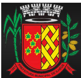
BRASÃO DE ILHÉUS