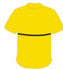
BATA DE GESTANTE COSTAS