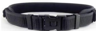
CINTO DE GUARNIÇÃO