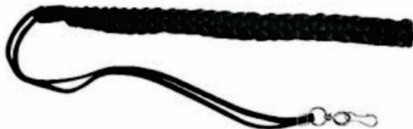
FIEL TRANÇADO PARA APITO