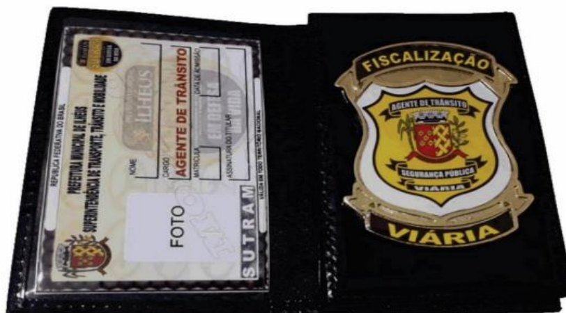
PORTA DOCUMENTO - CARTEIRA FUNCIONAL