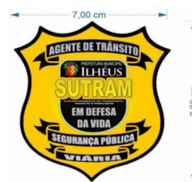
DISTINTIVO AGENTE DE TRÂNSITO