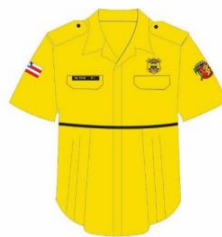
BATA DE GESTANTE FRENTE