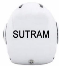
CAPACETE DE MOTOCICLISTA