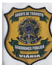
DISTINTIVO SEGURANÇA VIÁRIA