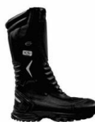
BOTA CANO ALTO