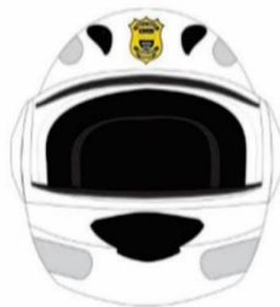
CAPACETE DE MOTOCICLISTA