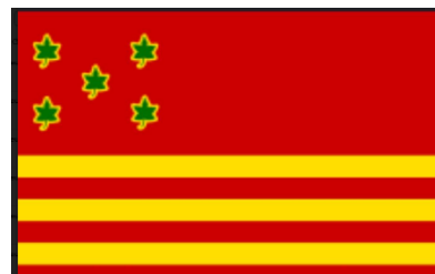
BANDEIRA DE ILHÉUS 8,00 cmx 6,00 cm