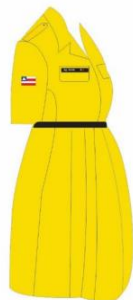
BATA DE GESTANTE LATERAL